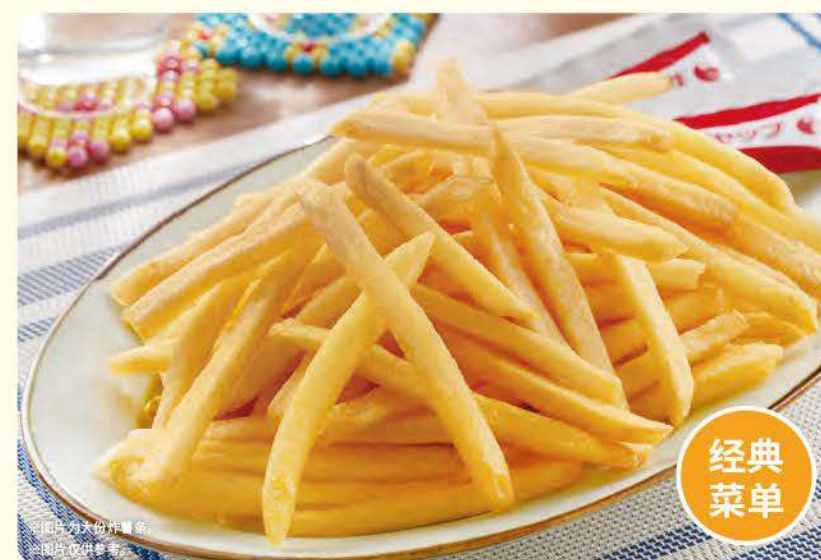
422 大份炸薯条 ¥369 (含税¥405)