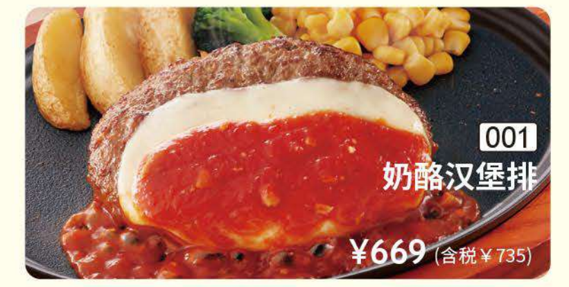
001 奶酪汉堡排 ¥669 (含税 ¥735)