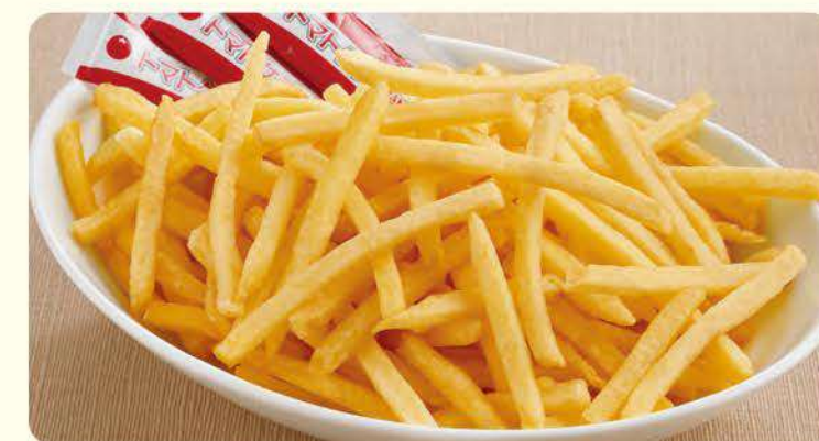
NEW 428 超大份炸薯条 ¥599 (含税¥658)