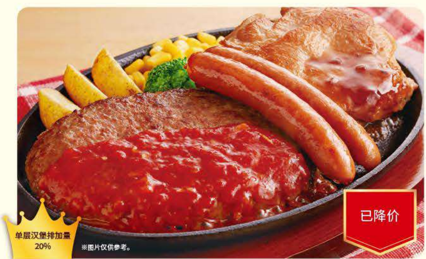
068 隆重登场! MAX铁板拼盘 ¥1,099 (含税 ¥1,208)