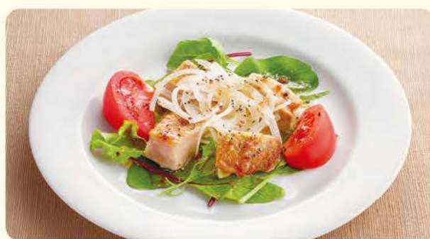
426 冷制烤鸡 ¥399 (含税¥438)