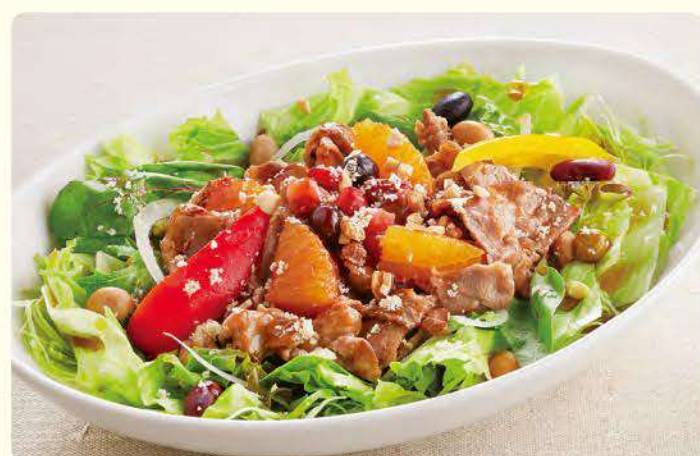
NEW 227 元气养生！ 薄切牛肉 混合豆能量沙拉 ¥769 (含税¥845)