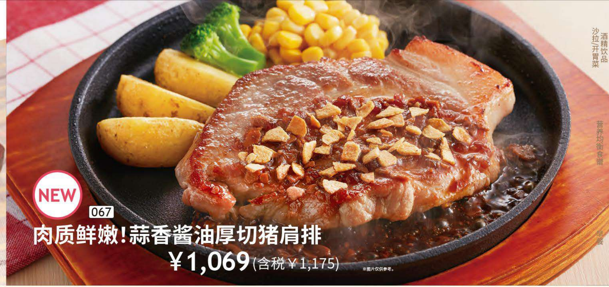
NEW 067 肉质鲜嫩! 蒜香酱油厚切猪肩排 ¥1,069 (含税 ¥1,175)