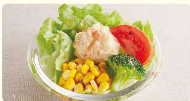
251 缤纷沙拉 ¥199 (含税¥218)