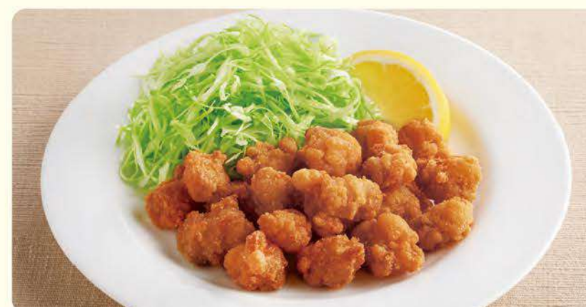
424 香酥鸡软骨 ¥399 (含税¥438)