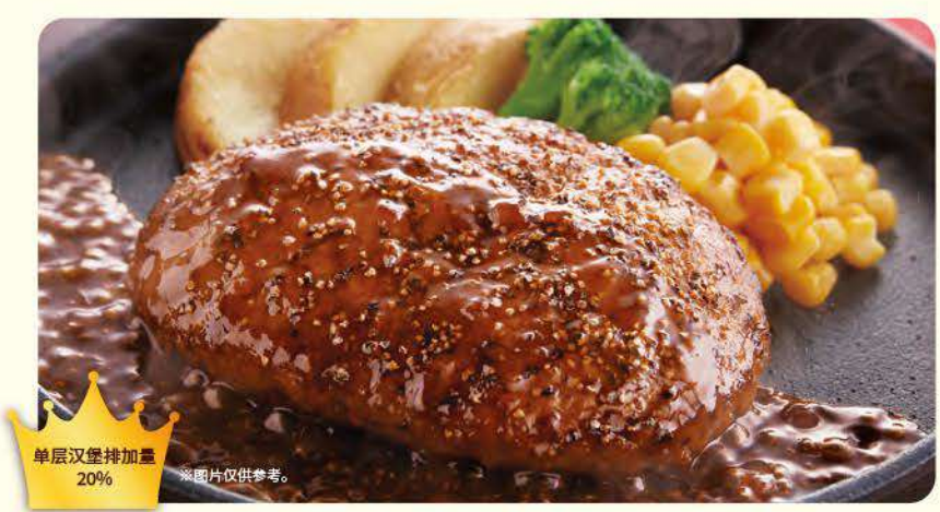
058 尊享胡椒汉堡排 ¥739 (含税 ¥812)