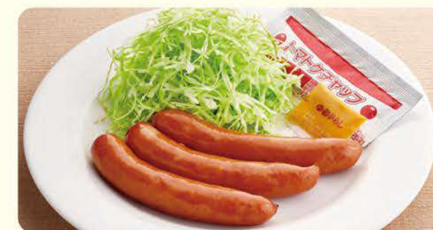
NEW 427 香肠(3串) ¥299 (含税¥328)