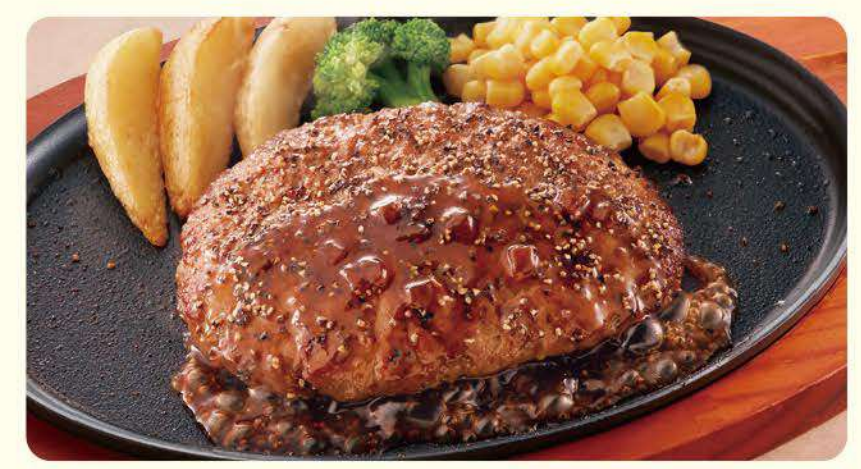
036 胡椒汉堡排 ¥639 (含税 ¥702)