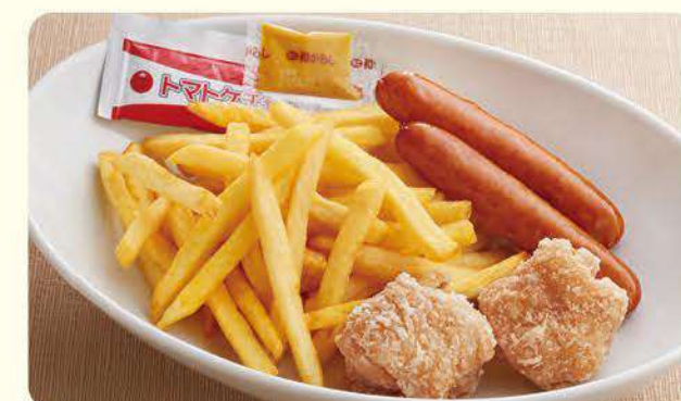
423 香酥鸡块&香肠 ¥469 (含税¥515)