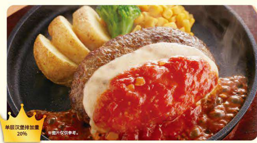
059 尊享奶酪汉堡排 ¥769 (含税 ¥845)