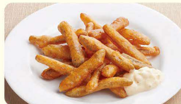
420 香酥牛蒡 ¥299 (含税¥328)