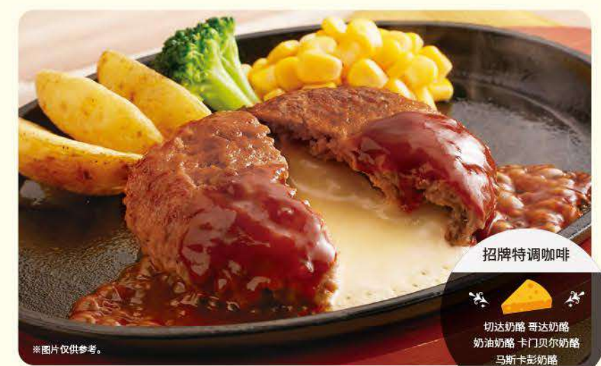
061 5种奶酪拉丝夹心汉堡排 ¥699 (含税 ¥768)