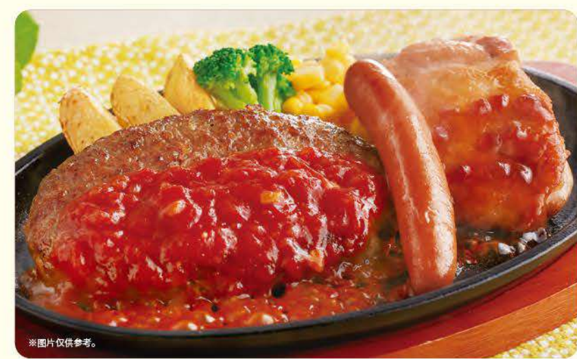
062 杂锦烤肉 ¥869 (含税 ¥955)