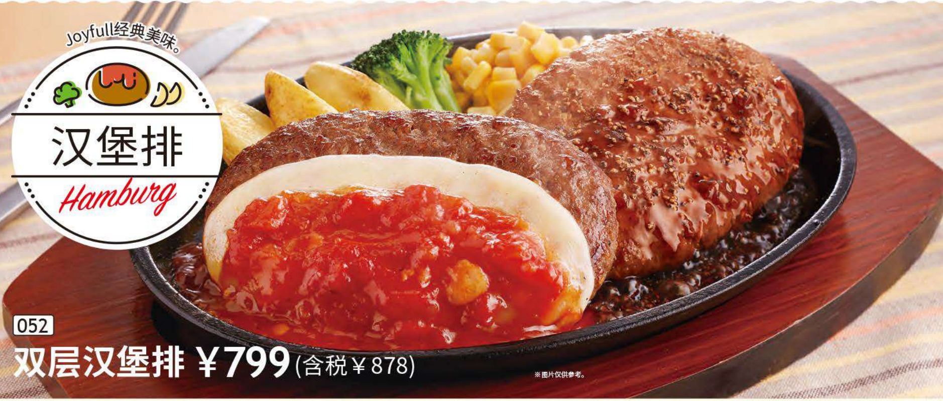
052 双层汉堡排 ¥799 (含税 ¥878)

※西式套餐、日式套餐的米饭不属于午餐特惠对象。 ※盂兰盆节、年末年初、黄金周等部分期间无特惠活动。 ※星期日、节假日均可下单。