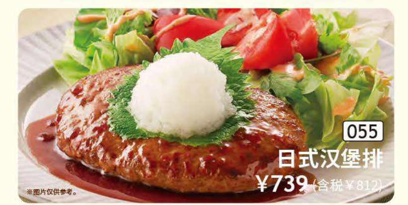
055 日式汉堡排 ¥739 (含税 ¥812)