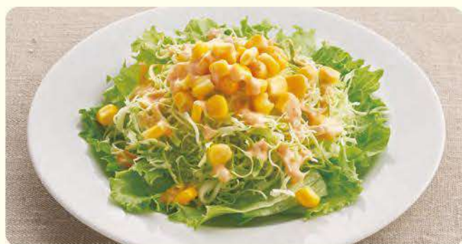
217 千岛沙拉 ¥99 (含税¥108)