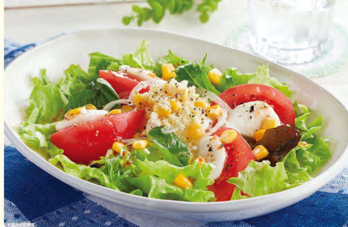
NEW 226 意大利莫扎里拉芝士卡布里沙拉 ¥569 (含税¥625)