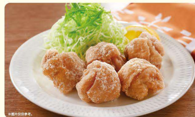
102 Joyfull盐味香酥鸡块(单品) ¥399 (含税¥438)