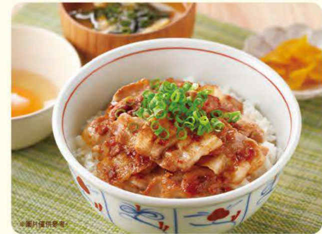
154 活力豬肉蓋飯 ¥799 (含稅 ¥878)