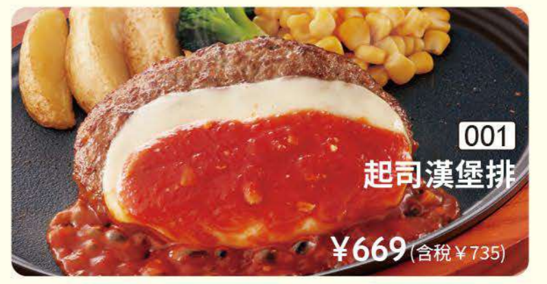
001 起司漢堡排 ¥669 (含稅 ¥735)