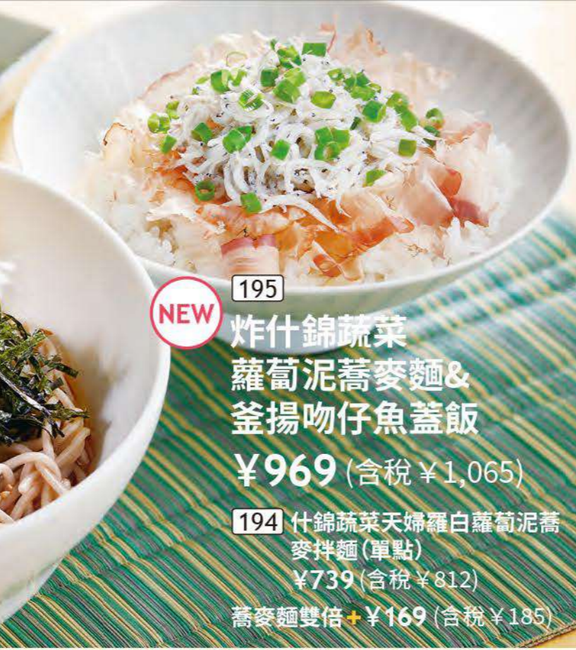
195 炸什錦蔬菜蘿蔔泥蕎麥麵&釜揚吻仔魚蓋飯 ¥969 (含稅 ¥1,065) 194 什錦蔬菜天婦羅白蘿蔔泥蕎麥拌麵(單點) ¥739 (含稅 ¥812) 蕎麥麵雙倍 + ¥169 (含稅 ¥185)