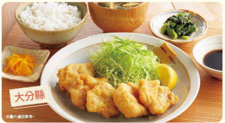
158 雞肉天婦羅定食 ¥799 (含稅 ¥878) 760 雞肉天婦羅(單點) ¥699 (含稅 ¥768)