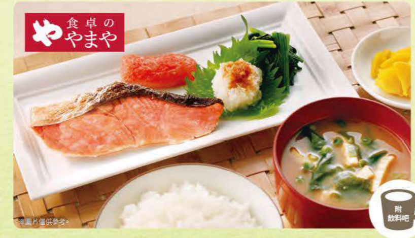
447 明太子烤鮭魚早餐 (使用餐桌的 Yamaya明太子) ¥639 (含稅¥702)