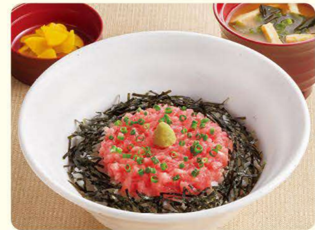
153 香蔥鮭魚泥蓋飯 ¥739 (含稅 ¥812)