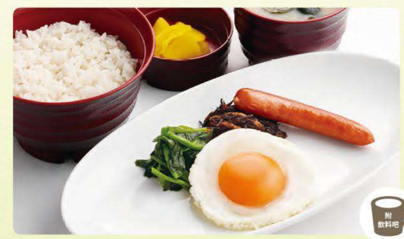
459 太陽蛋早餐 ¥439 (含稅¥482)