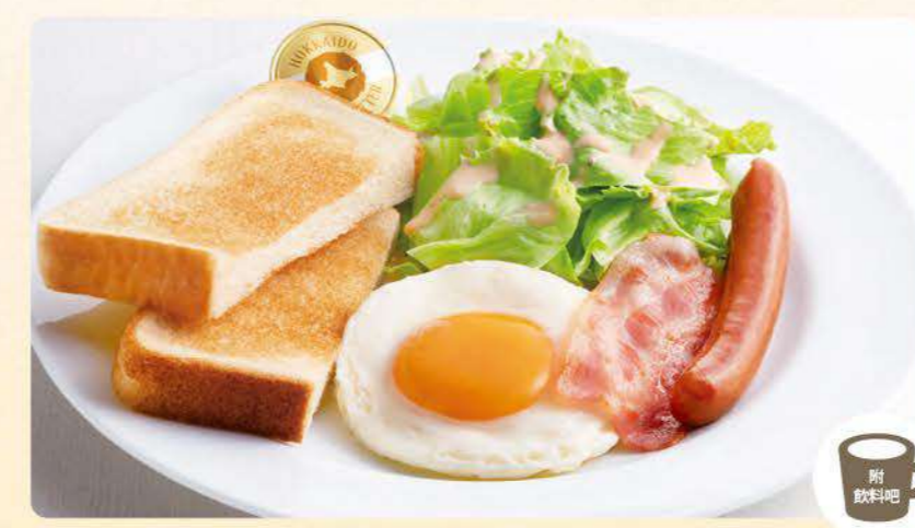
471 法式圓麵包 470 吐司 472 白飯 太陽蛋拼盤 ¥599 (含稅¥658) ※可選擇法式圓麵包/吐司/白飯。