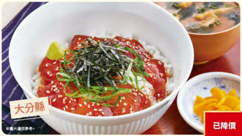
169 鯽魚琉球蓋飯 ¥999 (含稅 ¥1,098)