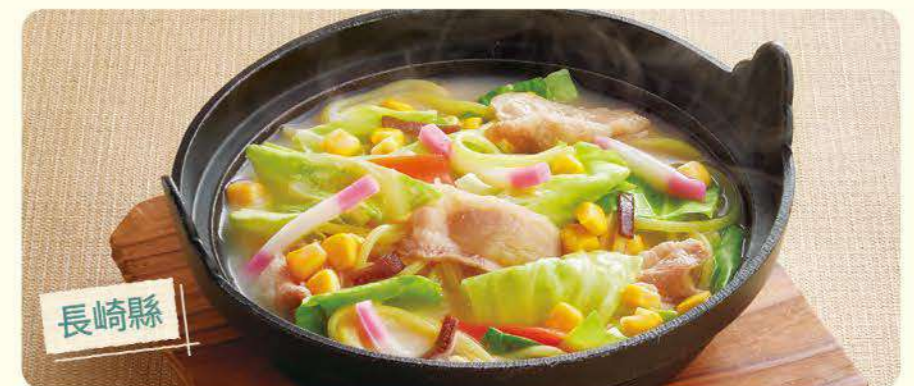
164 蔬菜多多強棒麵(單點) ¥869 (含稅 ¥955) 175 圖片為蔬菜MAX長崎什錦麵套餐(含白飯、炸雞、餃子) ¥1,199 (含稅 ¥1,318)