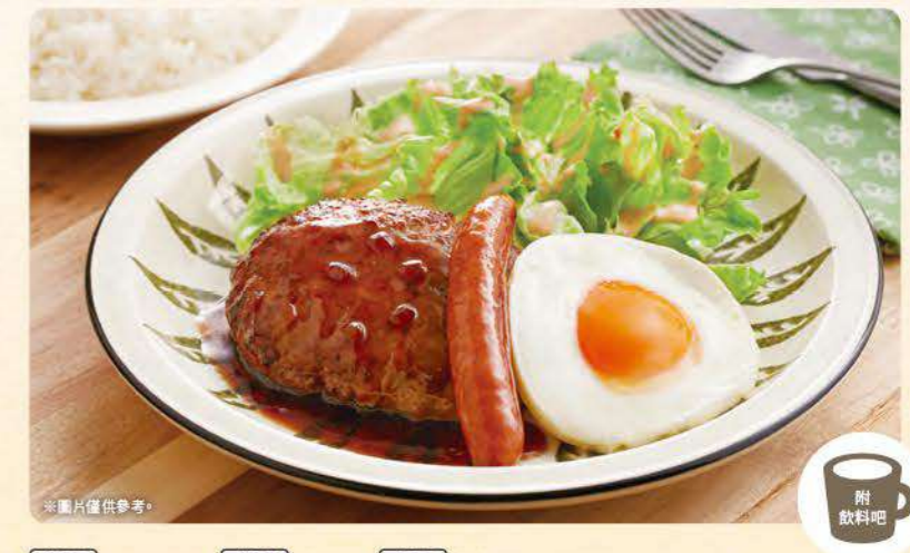
468 法式圓麵包 467 吐司 469 白飯 香腸太陽蛋漢堡排拼盤 ¥769 (含稅¥845) ※可選擇法式圓麵包/吐司/白飯。