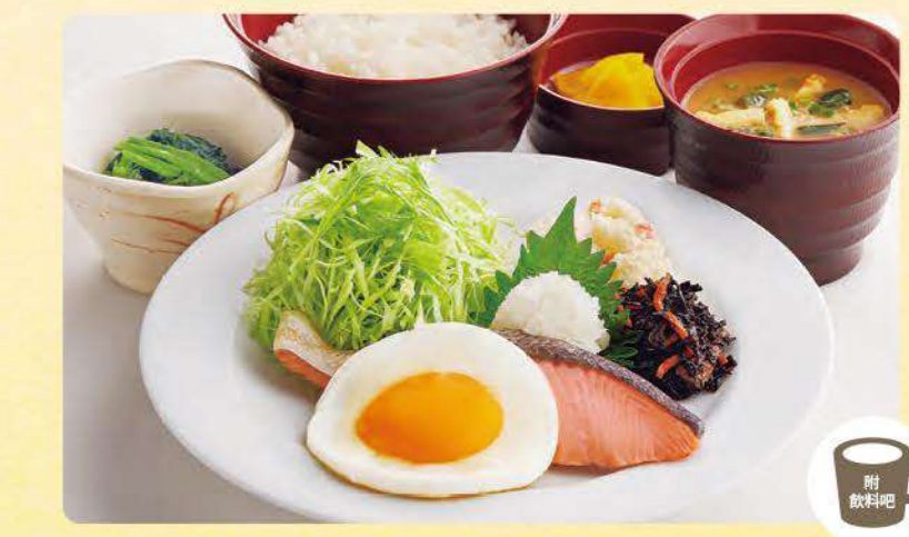
478 七色日式套餐 ¥799 (含稅¥878)