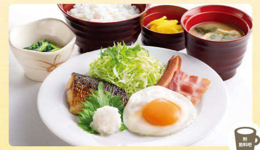
477 幕之內定食 ¥799 (含稅¥878)