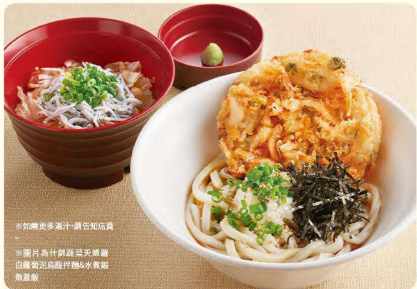
197 炸什錦蔬菜蘿蔔泥烏龍麵&釜揚吻仔魚蓋飯 ¥969 (含稅 ¥1,065) 196 什錦蔬菜天婦羅白蘿蔔泥烏龍拌麵(單點) ¥739 (含稅 ¥812) 烏龍麵雙倍 + ¥169 (含稅 ¥185)

※如贈更多湯汁·請告知店員 ※圖片為什錦蔬菜天婦羅白蘿蔔泥烏龍麵&水素蝦魚蓋飯 ※圖片僅供參考