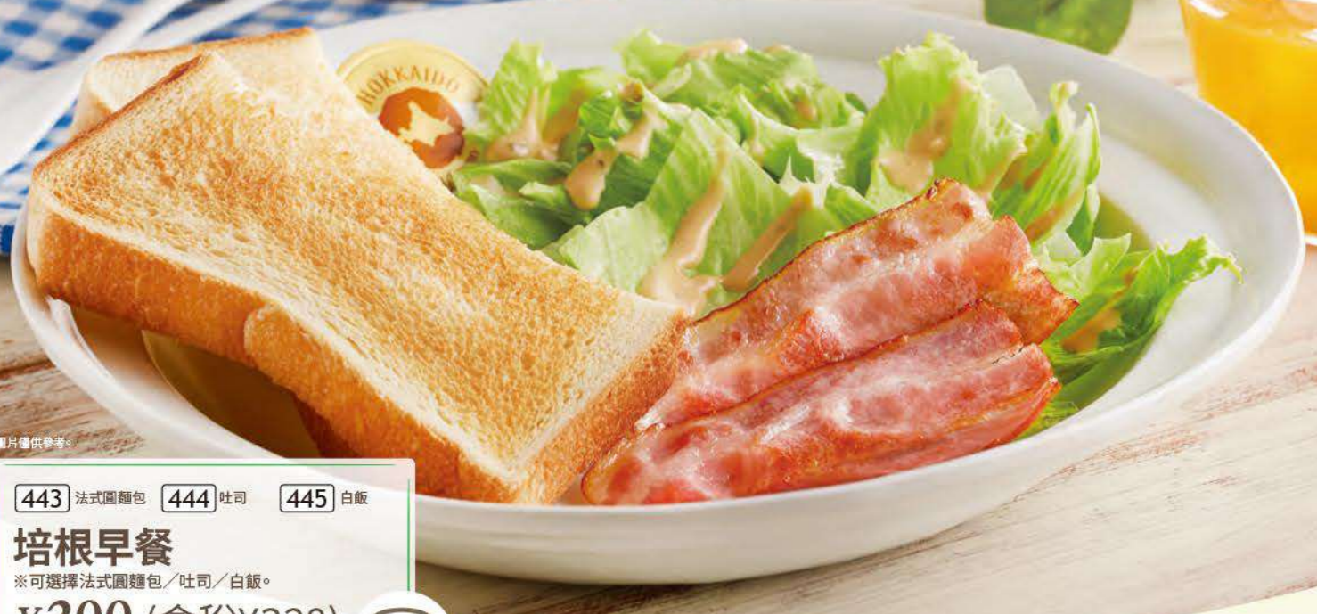
443 法式圓麵包 444 吐司 445 白飯 培根早餐 ※可選擇法式圓麵包/吐司/白飯。 ¥299 (含稅¥328)