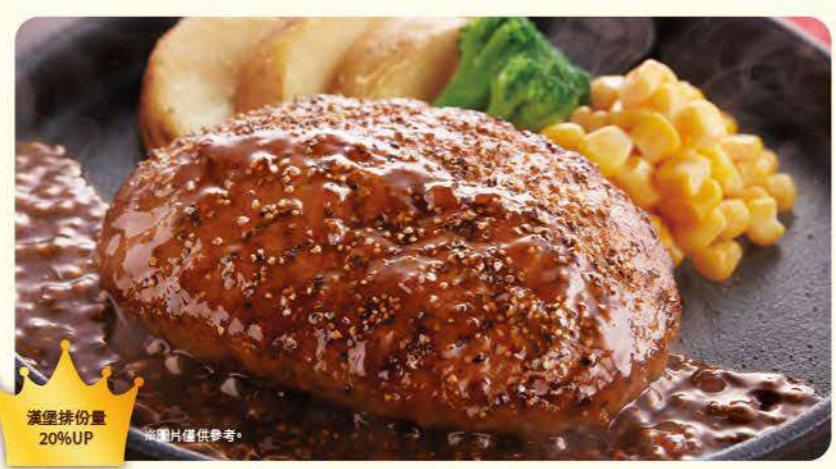
058 黑胡椒厚漢堡排 ¥739 (含稅 ¥812)