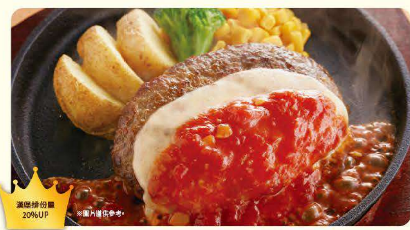
059 起司厚漢堡排 ¥769 (含稅 ¥845)