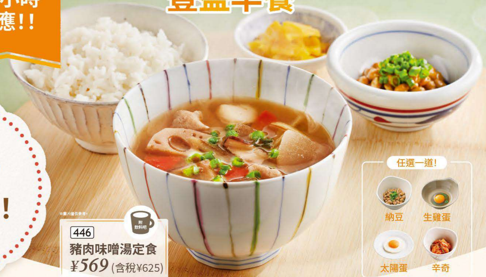
446 豬肉味噌湯定食 ¥569 (含稅¥625)