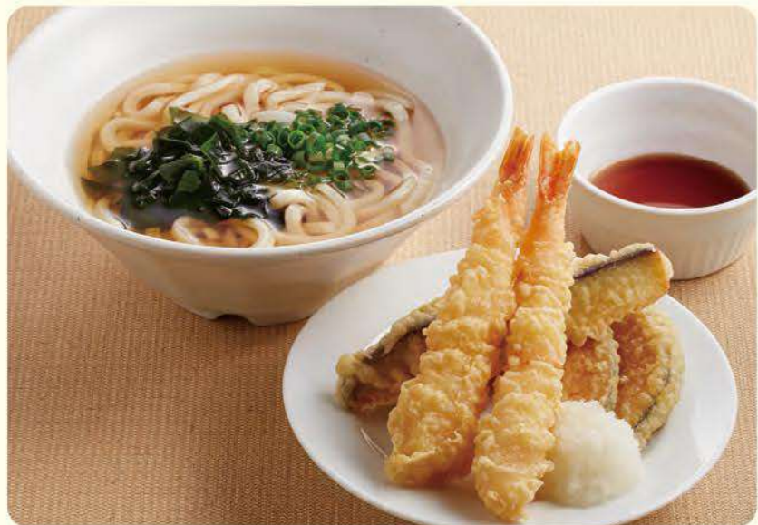
182 特製天婦羅烏龍麵(蝦、茄子、南瓜) ¥899 (含稅 ¥988) 烏龍麵雙倍 + ¥169 (含稅 ¥185)