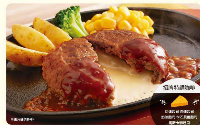
061 5種起司爆漿起司夾心漢堡排 ¥699 (含稅 ¥768) 招牌特調咖啡