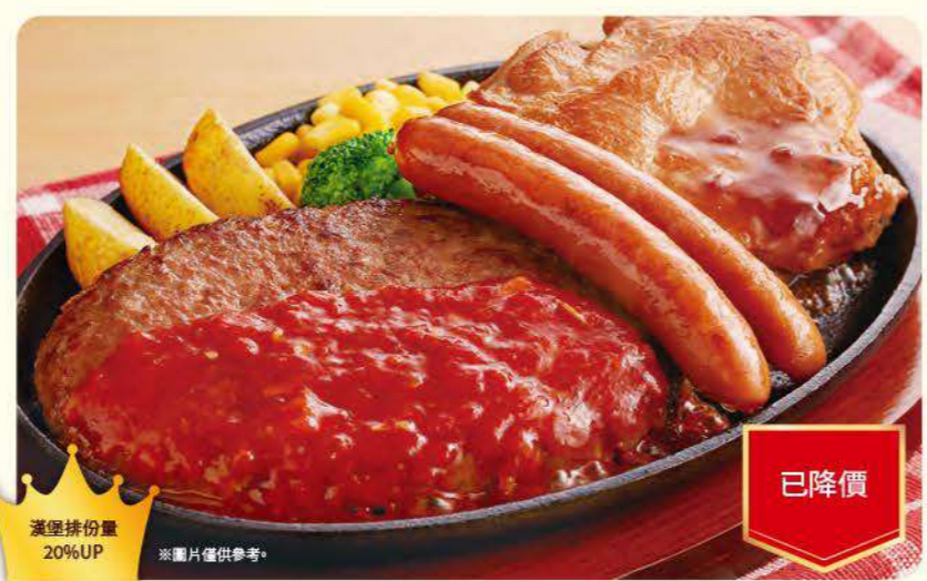
068 隆重登場! MAX鐵板拼盤 ¥1,099 (含稅 ¥1,208) 已降價