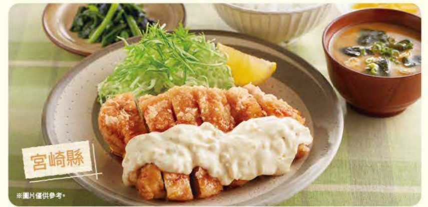
167 塔塔醬多多南蠻炸雞定食 ¥869 (含稅 ¥955)