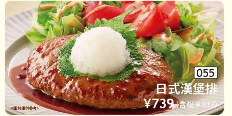
055 日式漢堡排 ¥739 (含稅 ¥812)