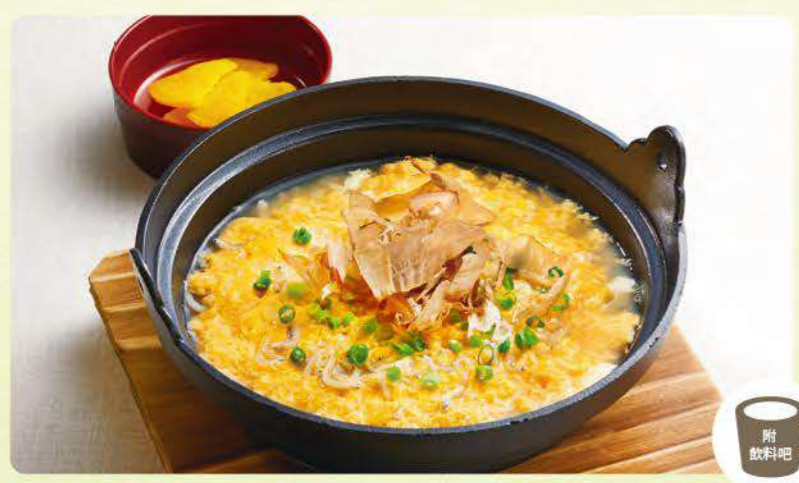
476 吻仔魚雞蛋鹹粥早餐 ¥439 (含稅¥482)