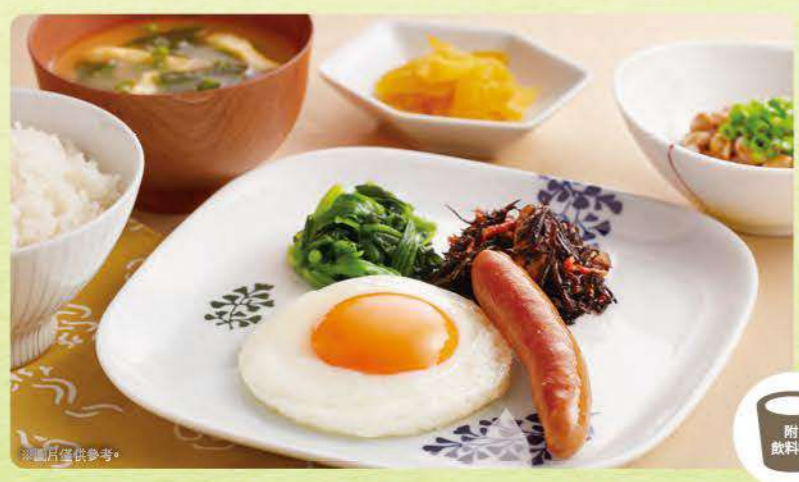
475 太陽蛋納豆早餐 ¥499 (含稅¥548)