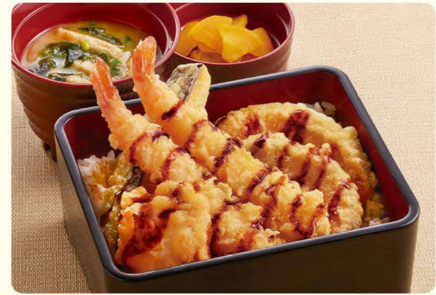
160 特製天婦羅盒飯(蝦、茄子、南瓜、雞肉天婦羅) ¥869 (含稅 ¥955)