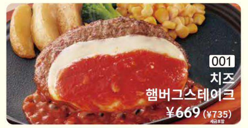
001 치즈 햄버그스테이크 ¥669 (¥735) 세금포함