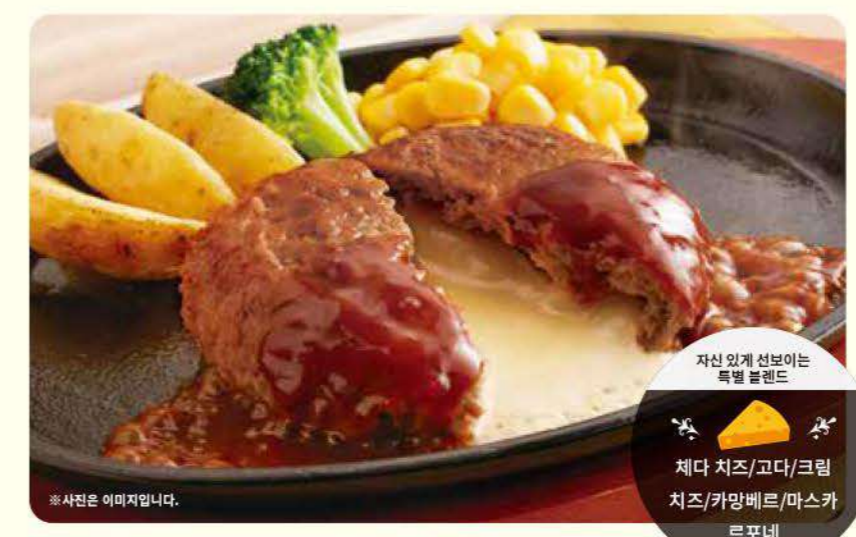
061 5종의 치즈가 녹아내리는 치즈인 햄버그스테이크 ¥699 (¥768) 세금포함