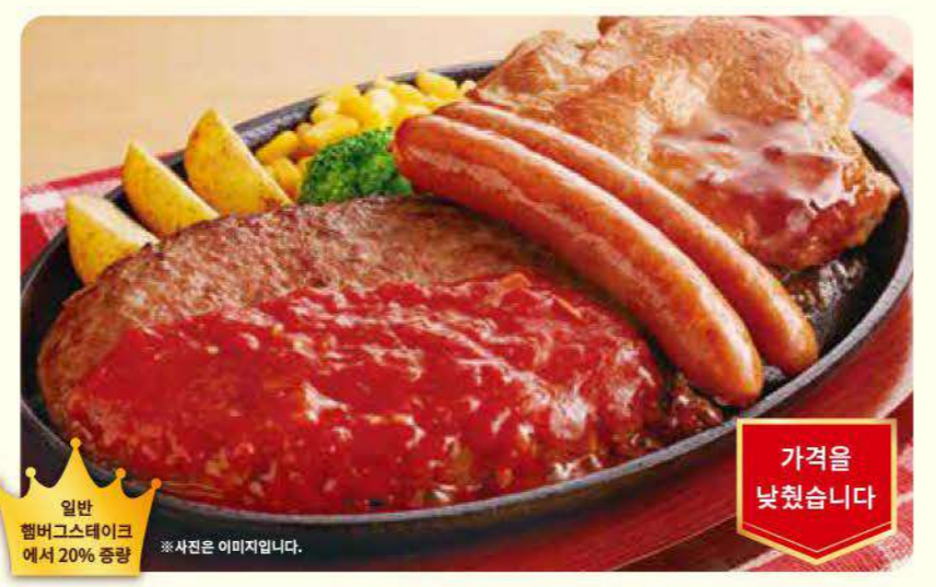
068 두둥! 푸짐한 믹스 그릴 ¥1,099 (¥1,208) 세금포함