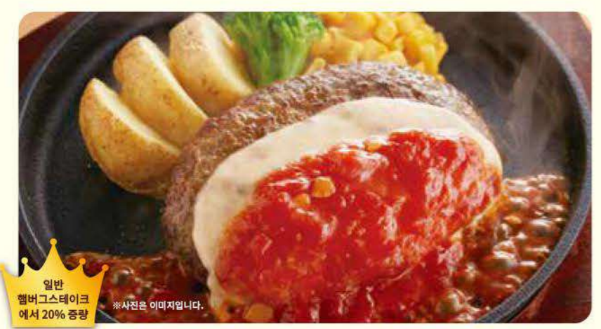
059 그랜드 치즈 햄버그스테이크 ¥769 (¥845) 세금포함