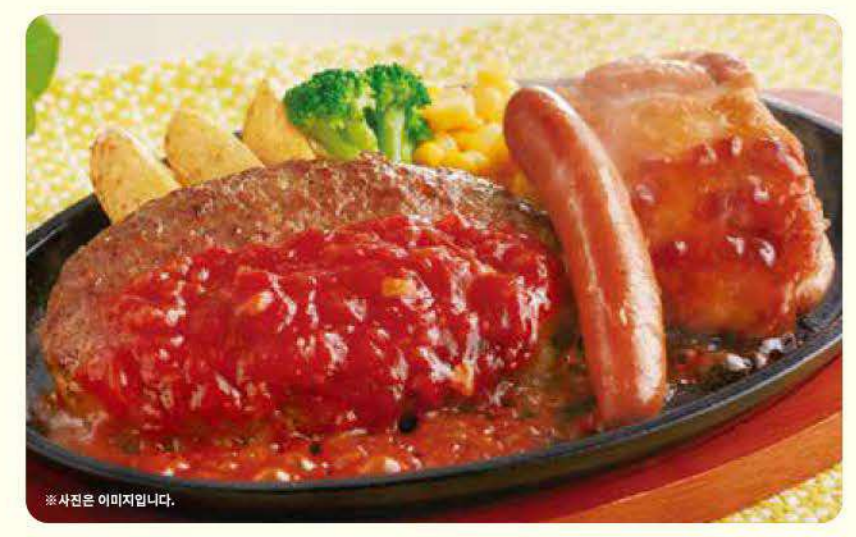
062 믹스 그릴 ¥869 (¥955) 세금포함