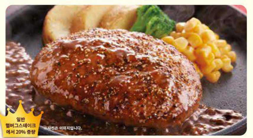
058 그랜드 페퍼 햄버그스테이크 ¥739 (¥812) 세금포함