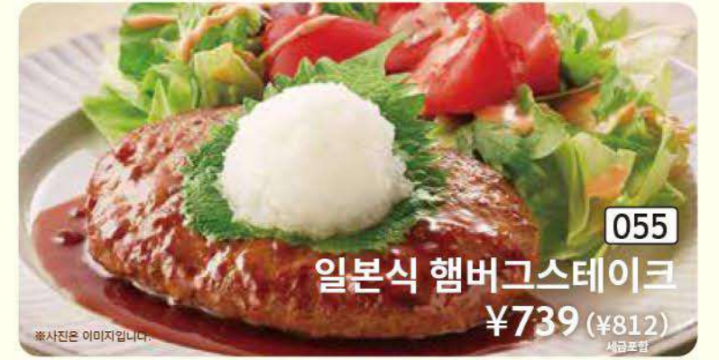
055 일본식 햄버그스테이크 ¥739 (¥812) 세금포함